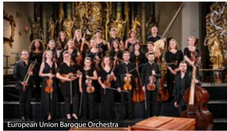
European Union Baroque Orchestra